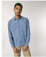
Stanley Innovates Denim

Shell : Gewebt denim , 100% gekämmte ringgesponnene Bio-Baumwolle , Am Stück vorgewaschen , Yarn Dyed , 170 GSM