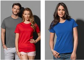
ST2020 Classic-T Organic